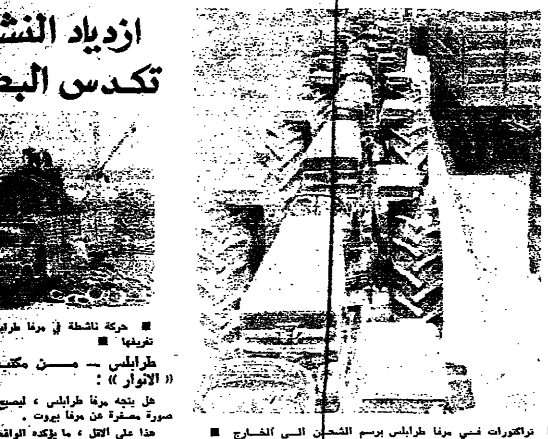
تراكورات نسي مرغا طرابلس برسم الشحن الى الخارج

وعلم في أواسط الشركة أن شركة دلتا للطيران ستسلم خلال سنة ١٩٧٦ ثلاث طائرات «ترياستار» - ١٠١١، جديدة، وذلك يصبح مجموع